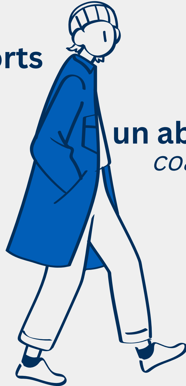
un abrigo coat