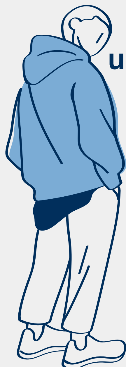
un suéter jumper