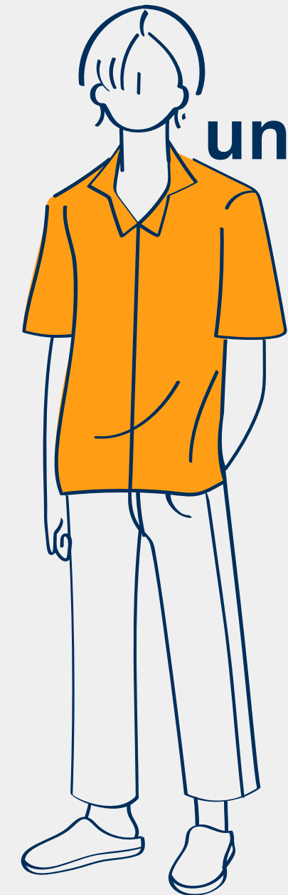
una camisa shirt