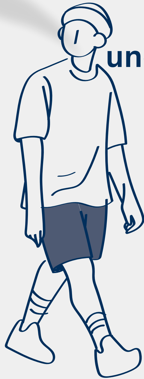
unos shorts shorts