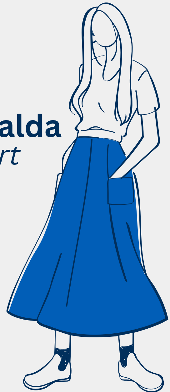
una falda skirt