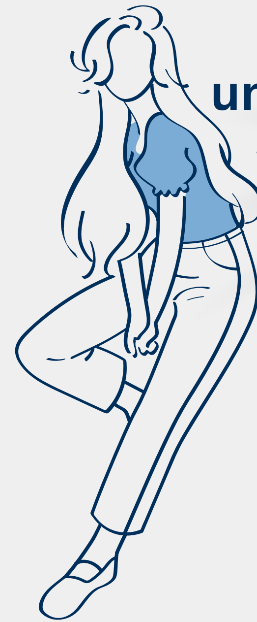
una blusa blouse