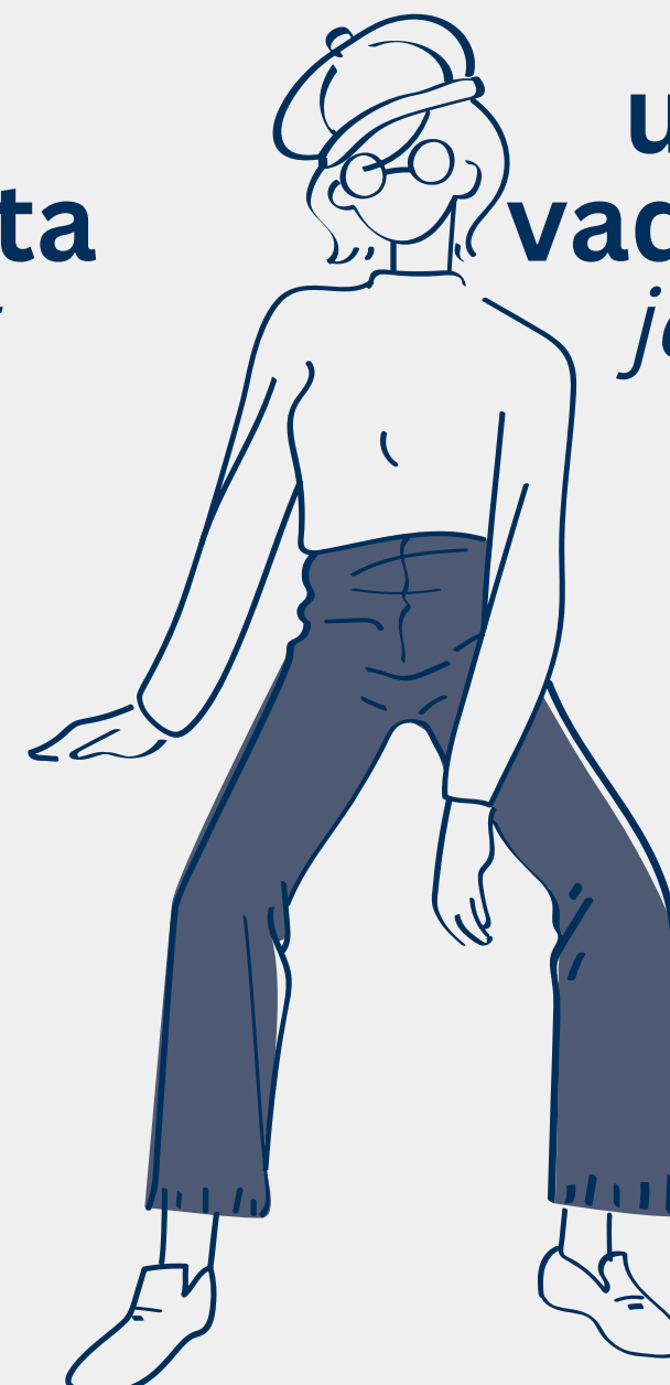
unos vaqueros jeans