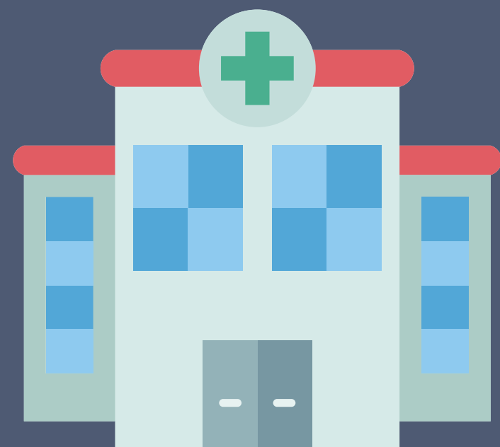
das Krankenhaus hospital