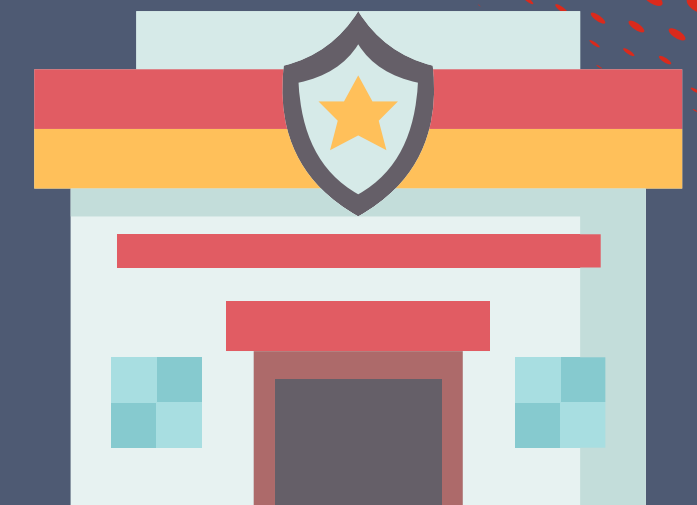
die Polizei police station