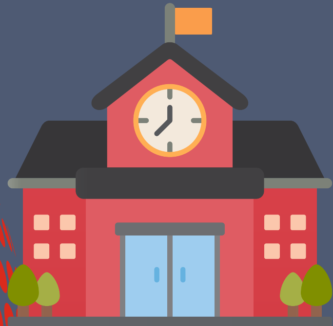
die Schule school