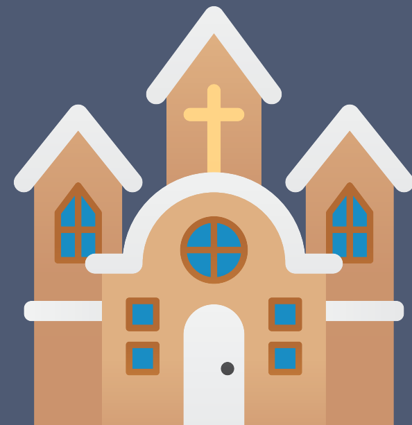
die Kirche church