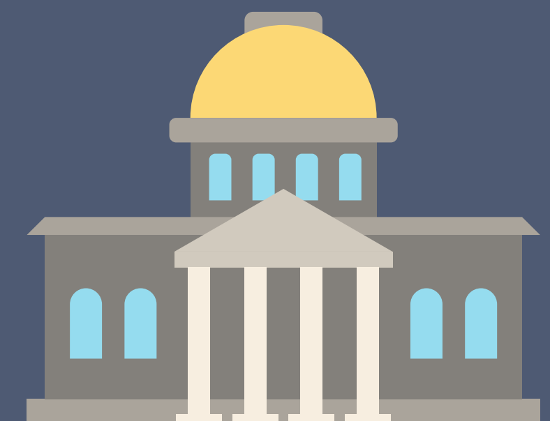
das Rathaus town hall