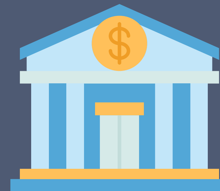
die Bank bank