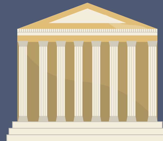
das Museum museum