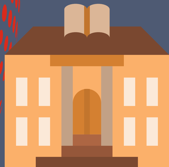
die Bücherei library