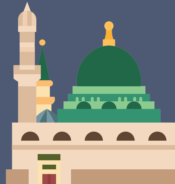
die Moschee mosque